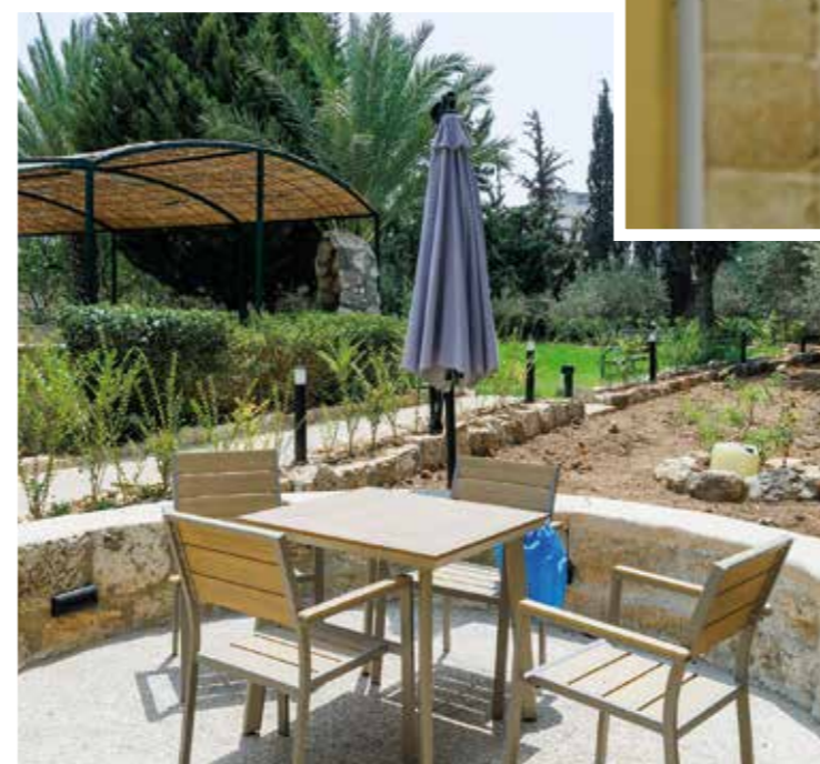
Nach hinten eröffnet sich eine Oase: Olivenbäume und Zypressen säumen eine Rasenfläche, Schattenplätze laden zum Verweilen ein

Das Zentrum bietet Einzeltherapien, Gruppentherapien und sogenannte Peer-to-Peer-Beratung an, ein niederschwelliges Beratungsangebot, bei dem ein partnerschaftlicher Austausch von Betroffenen auf Augenhöhe im Mittelpunkt steht.